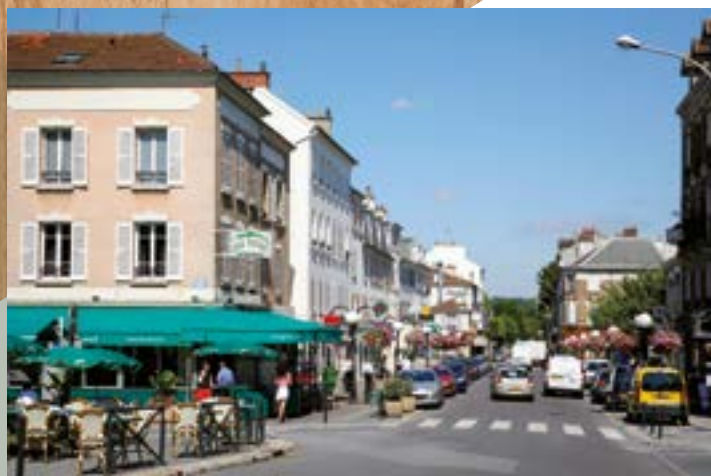
Rue Marcel Allégot