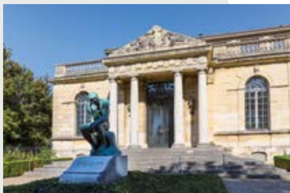
Villa des Brillants

À 650 m du RER C, dans le très prisé quartier de Val-Fleury, 42/Arthelon s'inscrit dans un environnement résidentiel qualitatif qui séduira les amoureux de sérénité. Ici, vous êtes bien au calme sur les hauteurs de Meudon, dans le voisinage immédiat de la forêt domaniale et du Parc Paumier. Toutes ces commodités qui simplifient le quotidien des actifs et des familles sont aussi à portée immédiate: commerces de bouche, supermarchés, pharmacie, coiffeurs, écoles maternelles, lycée, hôpital, sans oublier l'Observatoire, haut lieu de recherche et pôle d'activités parisien.