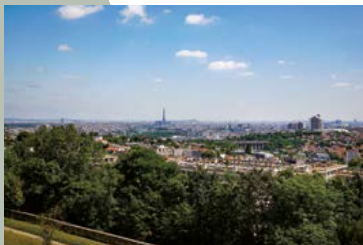
Vue de Meudon

À environ 10 km du centre de Paris, érigée sur des collines, une ville célèbre pour sa qualité de vie, coule des jours paisibles au sud d'une boucle de la Seine, tout en flirtant avec une vénérable forêt domaniale ainsi que le domaine national de Saint-Cloud. Soyez les bienvenus à Meudon !