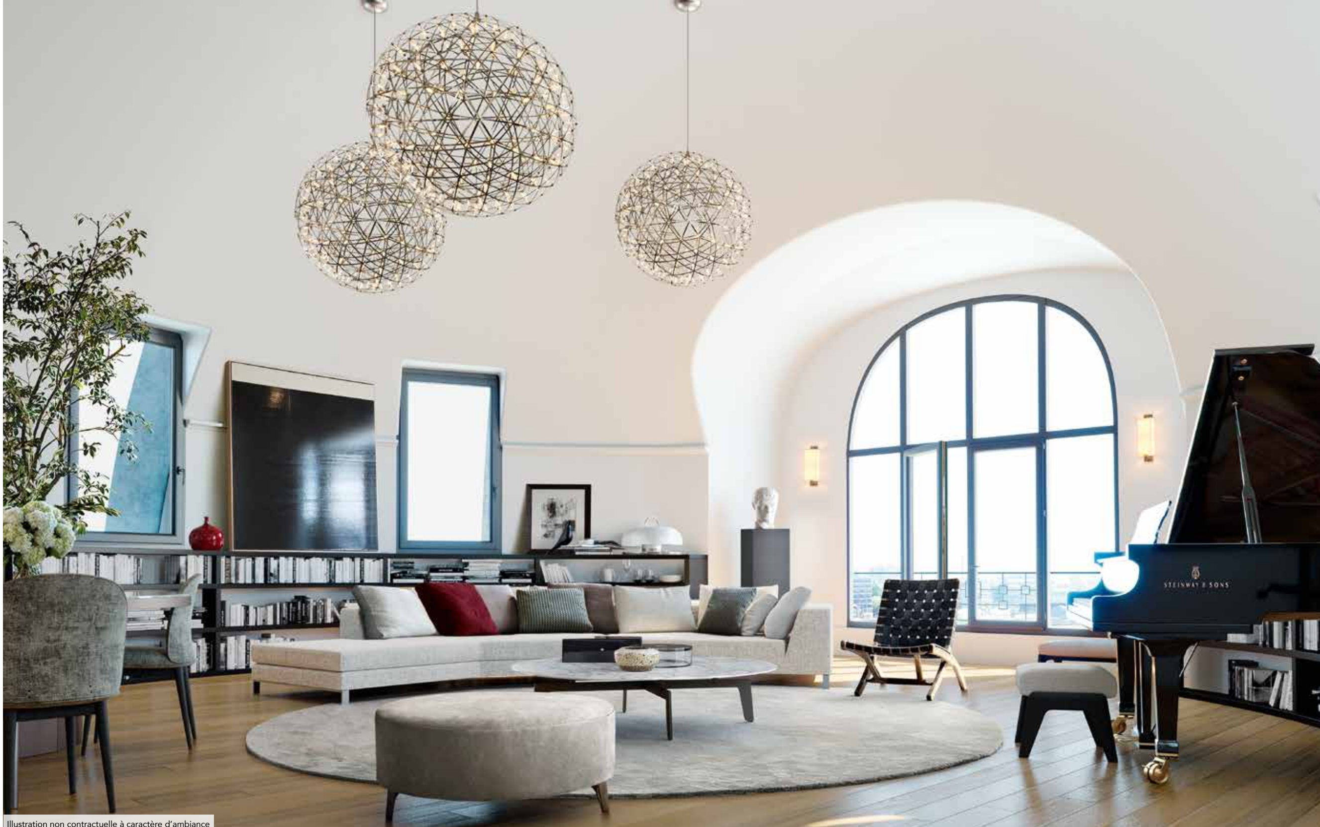
Illustration non contractuelle à caractère d'ambiance