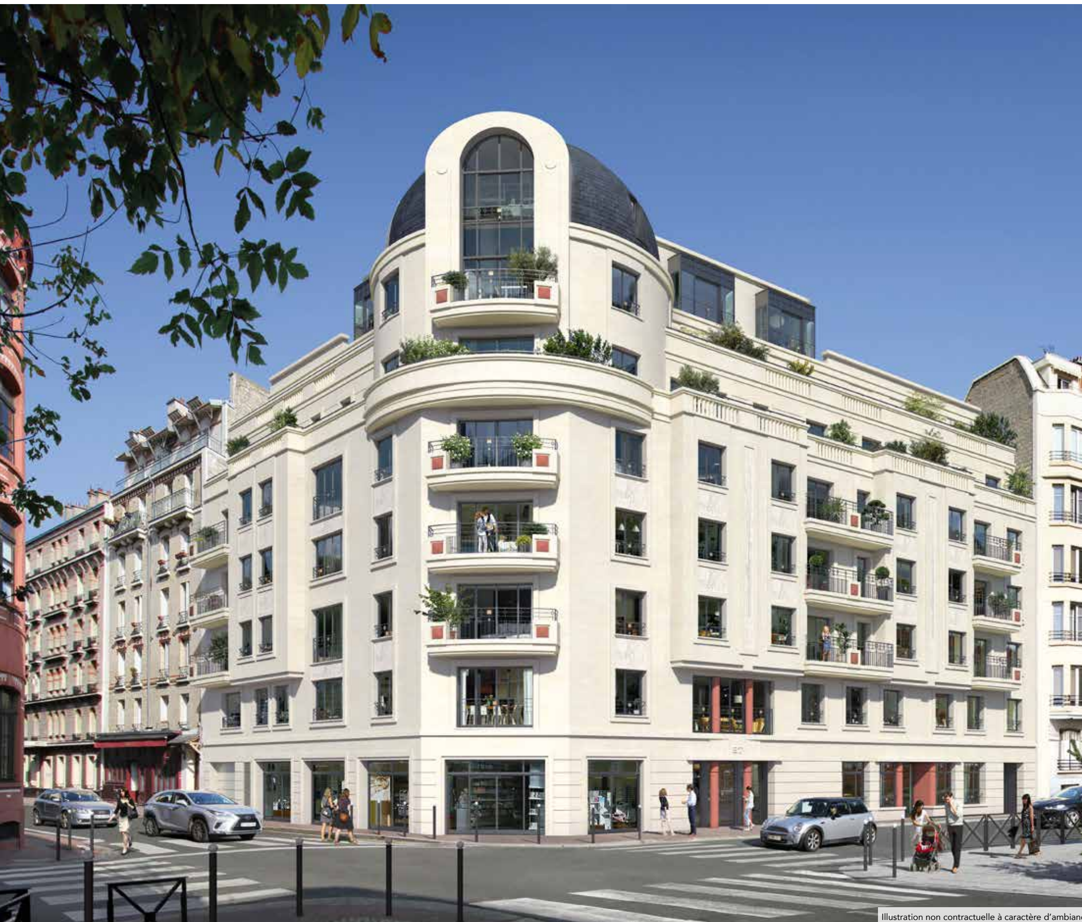
Illustration non contractuelle à caractère d'ambiance