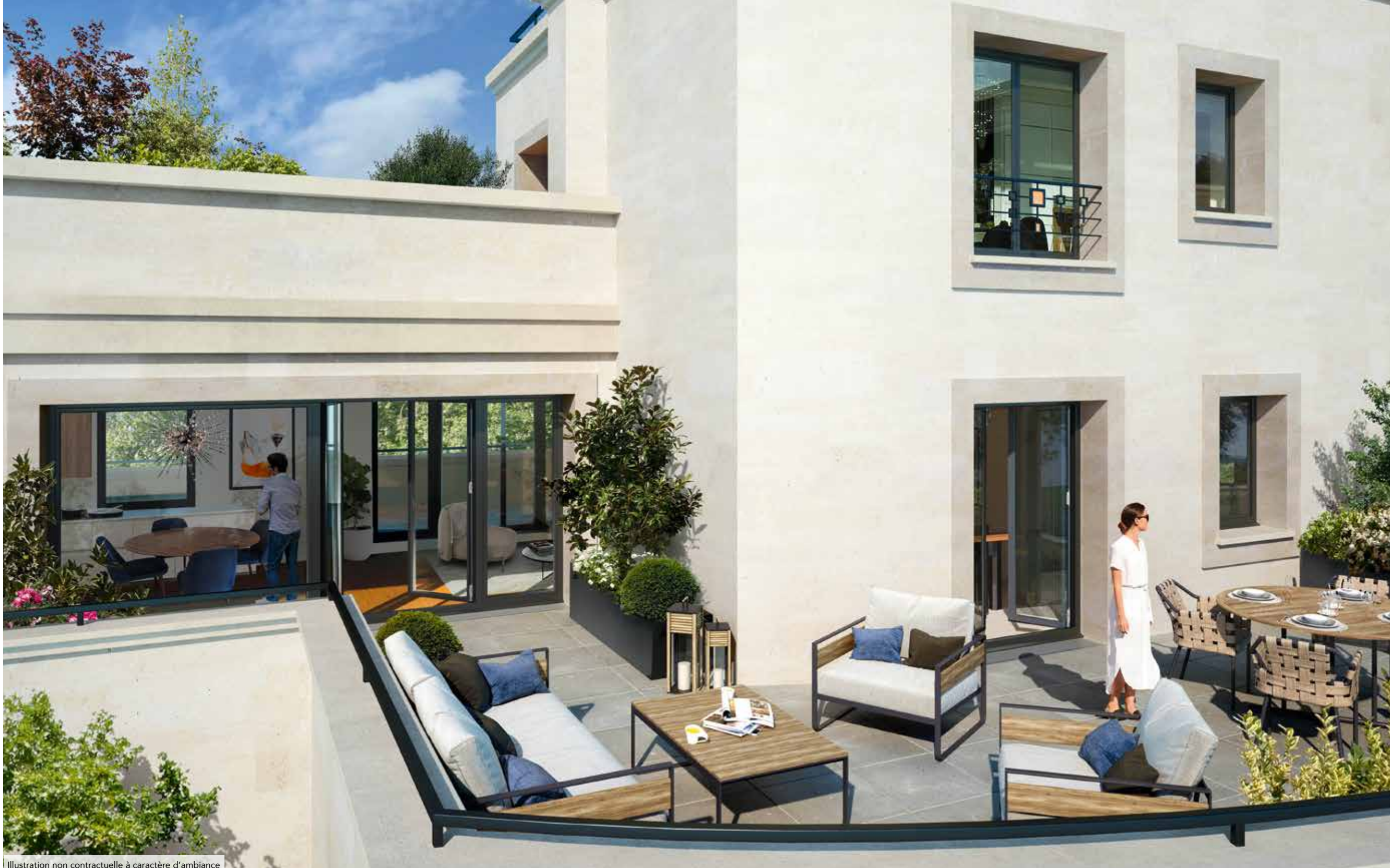
Illustration non contractuelle à caractère d'ambiance