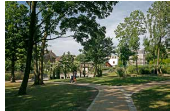
Parc du Bois-Saint-Denis