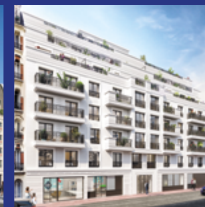
45 Chaptal - LEVALLOIS (92) Architecte : DGM & Associés