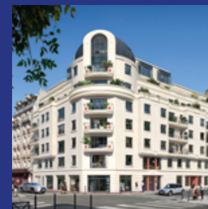
Capitole - LEVALLOIS (92) Architecte : DGM & Associés

C'est pourquoi COFFIM se tourne vers les nouvelles formes de l'habitat intégrant les effets de la révolution numérique afin d'offrir à ses clients le logement le plus adapté aux modes de vie, aux besoins actuels et futurs, tout en préservant l'environnement.