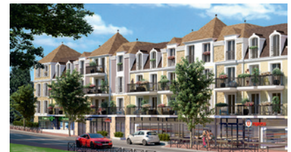
Villiers sur Marne - Pastels

Architecte : Agence Laurent Fournet Architectes