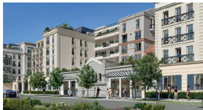
Gagny - Domaine de Gaïa

«DEMAIN», ENTEND AUSSI QUE NOUS DEVONS TOUS NOUS ENGAGER DANS NOTRE QUOTIDIEN.