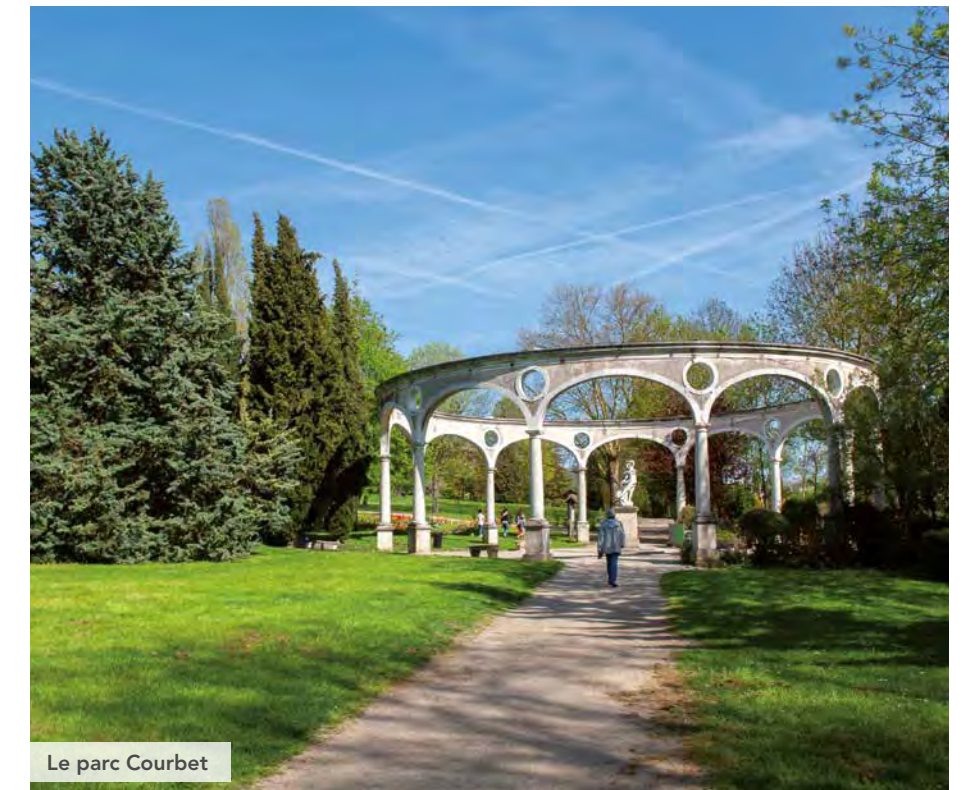
Le parc Courbet