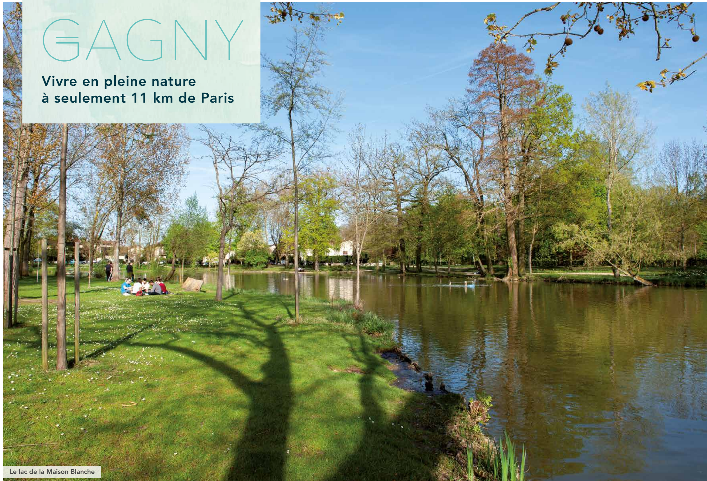
Le lac de la Maison Blanche

Vivre en pleine nature à seulement 11 km de Paris