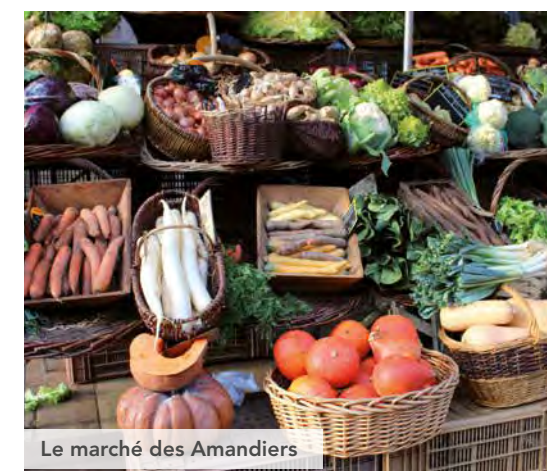
Le marché des Amandiers

Outre le patrimoine historique de la ville, Gagny se distingue par ses espaces paysagers qui jalonnent son territoire : le parc forestier du Bois de l'Étoile, l'Arboretum ou le lac de la Maison Blanche sont autant de lieux de détente et de balade pour ses habitants.